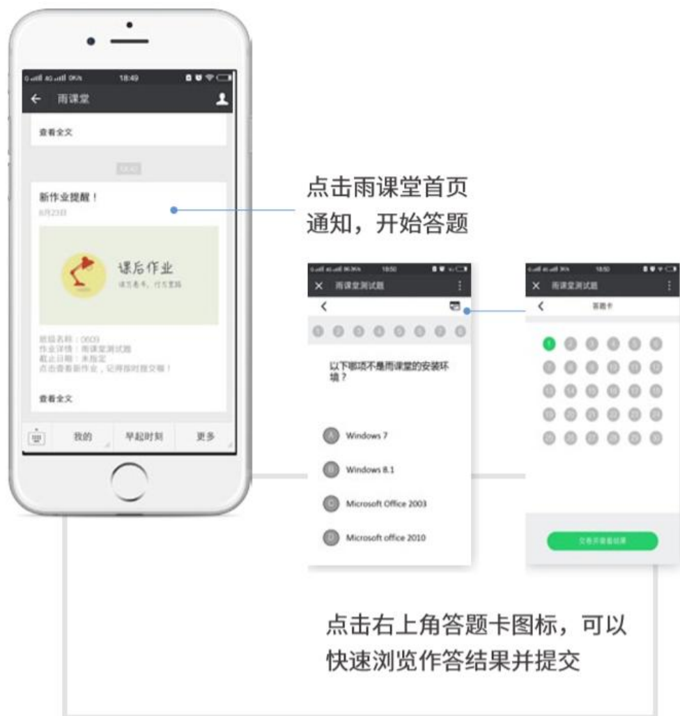
图 16 作业提醒