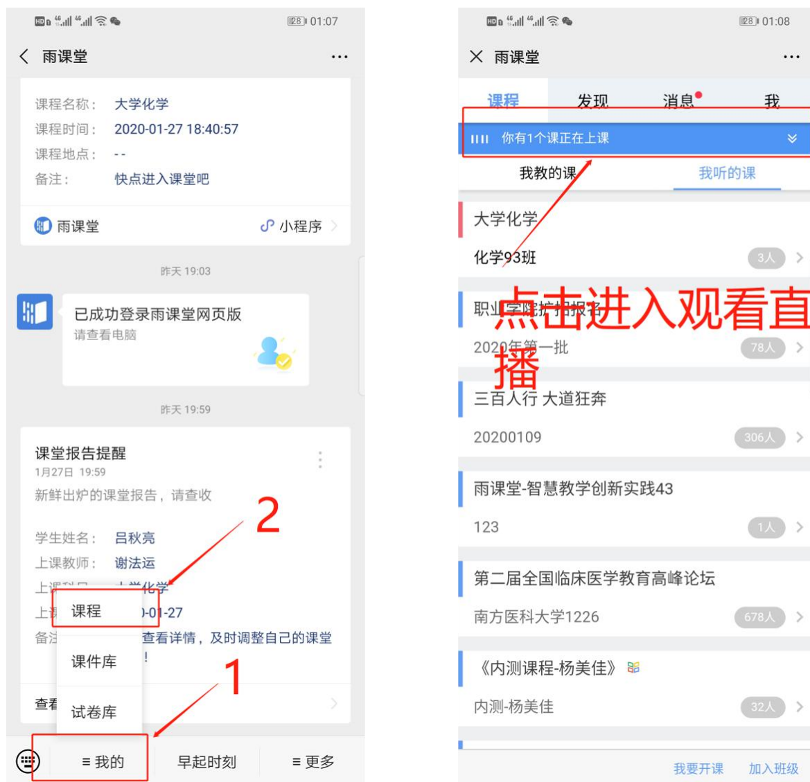
图6 公众号进入直播