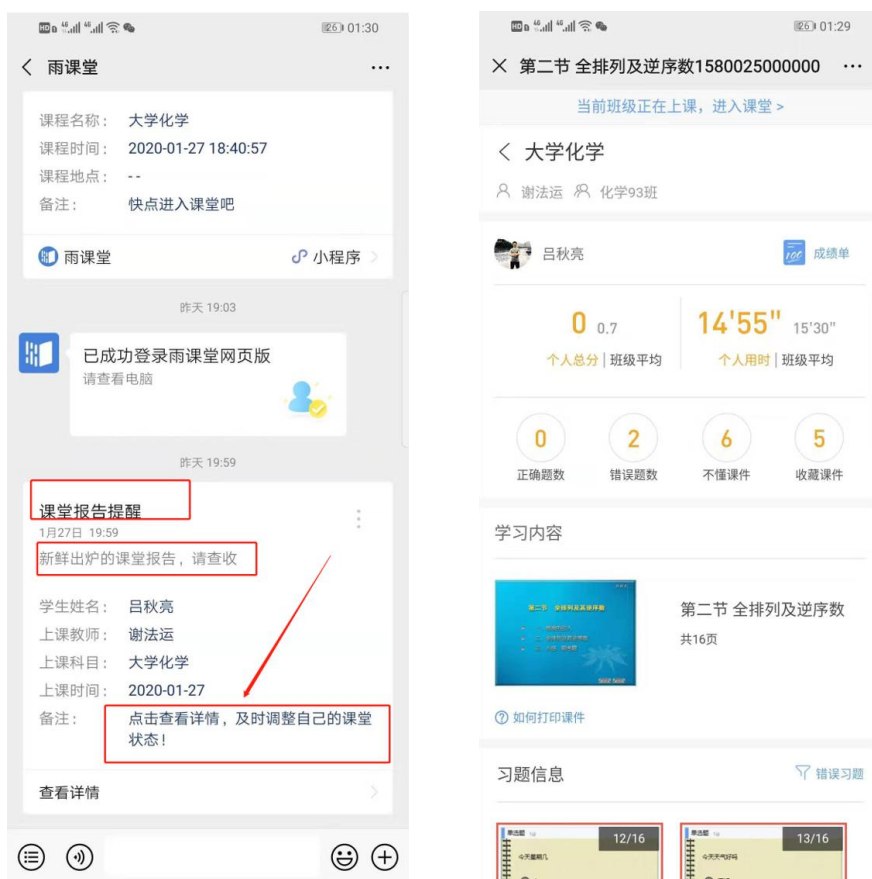
图 14 课堂报告

每次直播结束后每位同学都会收到雨课堂自动推送给大家的学习报告。错误习题、不懂课件、收藏课件、课程 PPT，雨课堂都帮各位同学整理好，关注每一节课的动态，助力你的改变和成长，如图 14 所示。