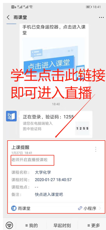
图3 学生接收上课直播提醒

(1) 教师可在开启直播时给学生发送通知,学生可在微信公众号里收到直播提醒,点击此消息即可进入直播。如图3所示。