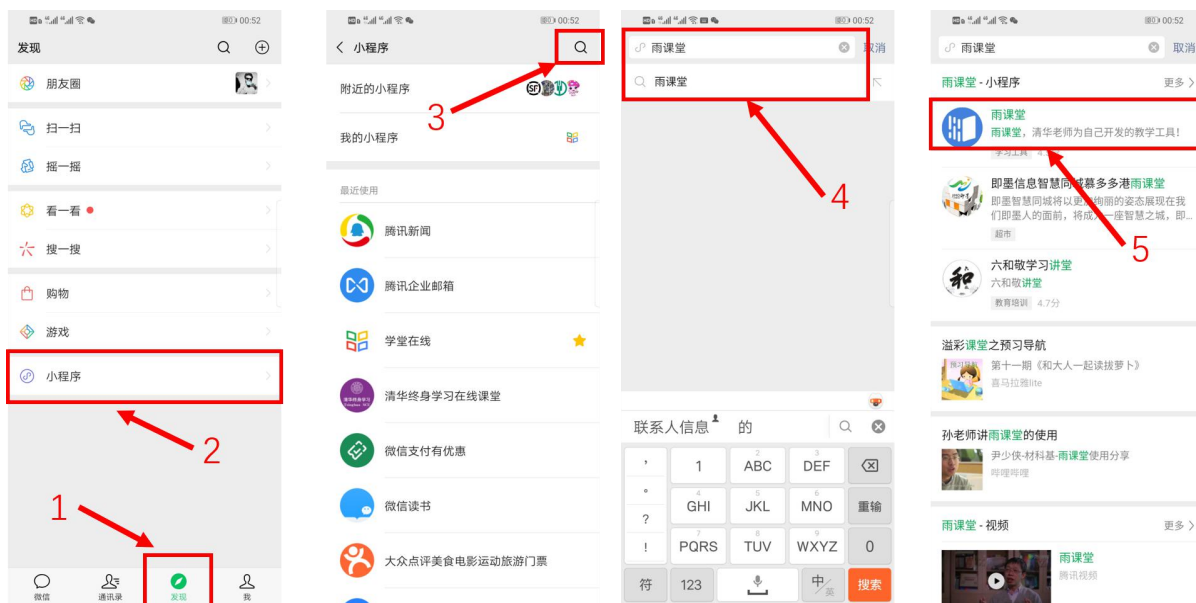
图 4 搜索进入雨课堂小程序

进入雨课堂小程序后，在小程序上方若发现有“你有 1 个课正在上课”的提示，点击该提示即可进入直播。如图 5 所示。