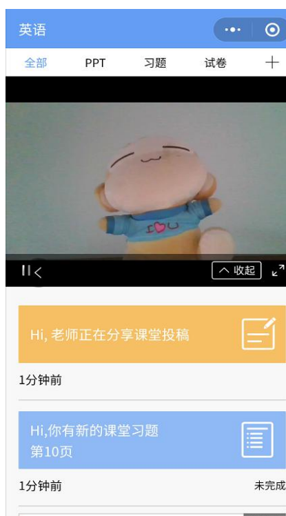
图 9 学生手机端直播预览效果

学生端手机端视频直播效果预览如图 10 所示,无论使用语音直播或视频直播,远程授课可同时进行随堂测试、弹幕、投稿等课堂活动。