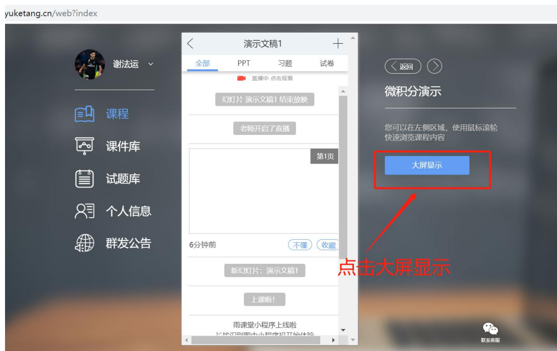
图 9 可进入大屏显示