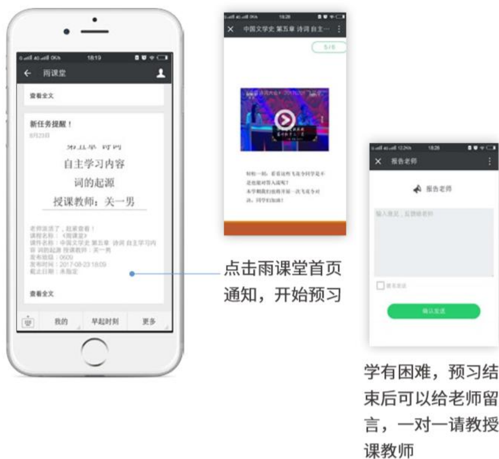
图 15 接收预习任务并完成预习

若老师给学生推送了预习资料，各位同学将在雨课堂公众号里收到相应的通知提醒，点击该提醒即可启动预习，预习之后带着思考去上课。（ 温馨提示：请在老师规定时间内完成预习。老师能看到你什么时候完成预习，预习了哪几页等信息 ）