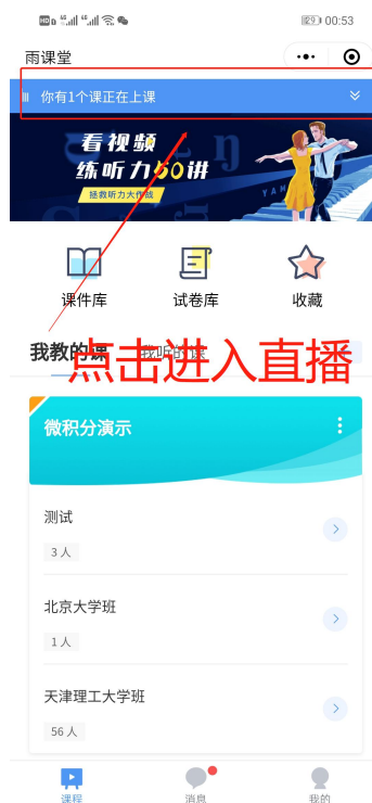
图 5 小程序进入直播界面

进入雨课堂小程序后，在小程序上方若发现有“你有 1 个课正在上课”的提示，点击该提示即可进入直播。如图 5 所示。